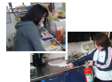
初期消火と消防への通報