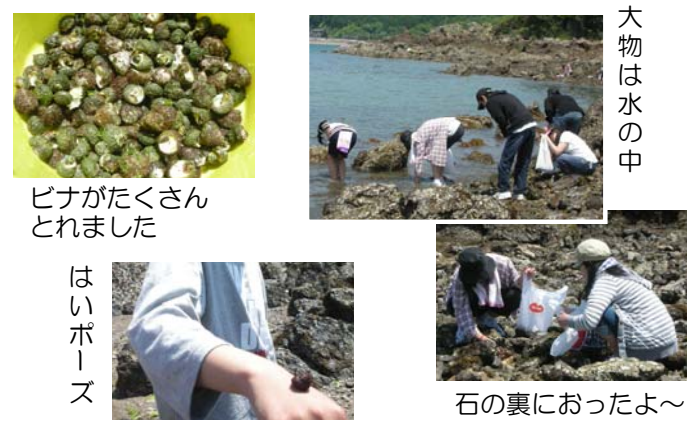
ピナがたくさんとれました

潮のいい日を選んで三ツ島海水浴場へ磯あそびに出かけました。潮が引いてしまうと普段は隠れている岩場が現れます。海を眺めながらお弁当を食べた後、バケツや袋を片手に岩場へ一直線。“さかなの赤ちゃん”“うみうし”“イソギンチャク”“やどかり”等など、賑やかな潮溜まりを横目に、ピナ獲りを始めました。初めてピナを獲る人も、みんなに手伝ってもらい袋いっぱい収穫がありました。