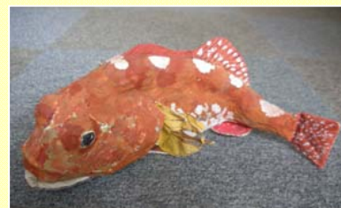
制作期間は1週間。新聞紙に習字紙を貼って色付けしました。顔の表情が難しかったです。

体をくねらせ、顔の表情もいきいきしています。岩場にかくれてエサになる小魚を待っています。