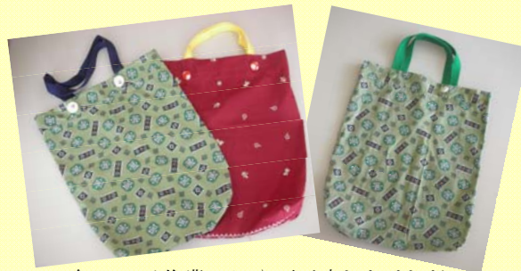
細かい手作業で目や肩が疲れたけれど出来上がってとってもハッピー～。

活動やお買い物の時に必需品になったマイバッグを手作りで作ってみました。一針ひと針でいねいに！仕上げにはカワイイくみボタンでワンポイント！！世界に一つだけのマイバッグが出来上がりました。