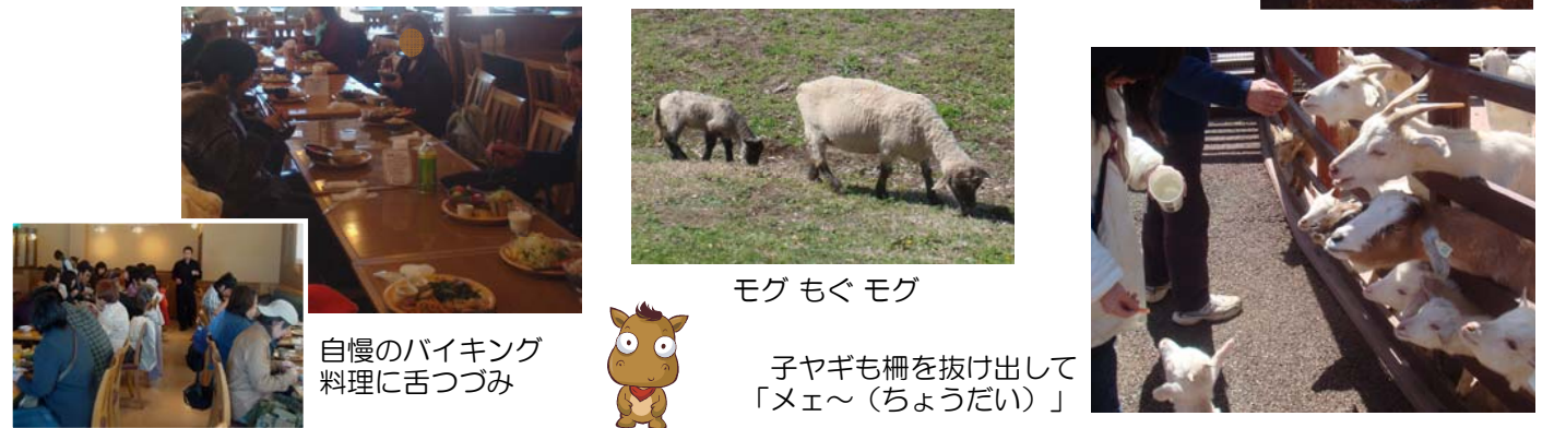
自慢のバイキング料理に舌つみ

今年も前回好評だった阿蘇ミルク牧場へ出かけました。美味しいバイキング料理をおなか一杯食べた後、それぞれグループに分かれて園内を散策しました。かわいい動物たちと触れ合って楽しい一日になりました。