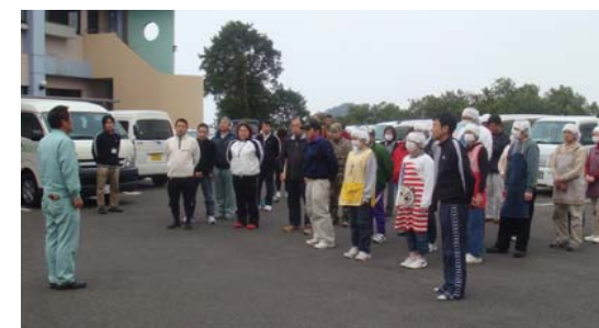
立尾電設さんによる講評