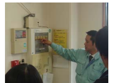
火災受信機の操作講習