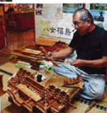
伝統の技を守る名人さんたち