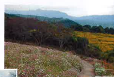
遠くにはセイトカアワダチソウの群生も!