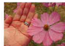
大輪のコスモスを発見

水俣市内にある「中尾山コスモス園」のコスモスが満開になるのを待ってコスモス見物に出かけました。市内が一望できる見晴らしのいい場所を探し、持参したシートを広げコスモスを眺めながらのお弁当はもう最高でした。食後は早速コスモス園を散策する人、ビーチバレーで腹ごなしをする人...。思い思いの時間を過ごしました。満開のコスモスに負けないうらいみんなの笑顔も素敵な一日でした。