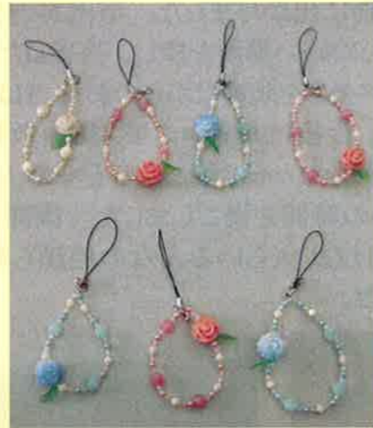
同じ材料でも、組み合わせ一つで私だけのストラップが完成しました