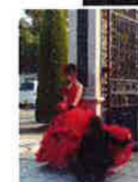
きれいな花嫁さんに“うっとり”