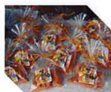
おみやげの甘夏かりんとうは大好評でした