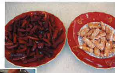
美味しいかりんとうの出来上がり〜