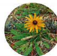
咲か歩いてのまい片し花隅たがにも