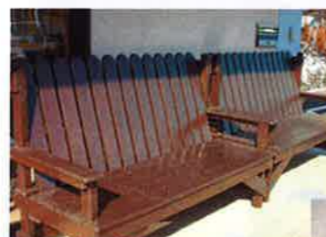
これからの季節ひなたぼっこが最高!

いつまでも暑さが厳しく、思うように作業が進まなかったのですが、とても立派なベンチが2脚完成し、まどか園の玄関の横に据えられました。みなさんが腰掛けて楽しそうにおしゃべりしている姿を見て、うれしく思っています。