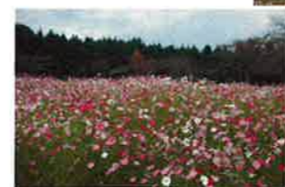
満開のコスモスに迎えられました