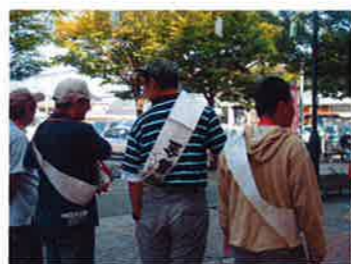
今年も多くの方に募金をしていただきました