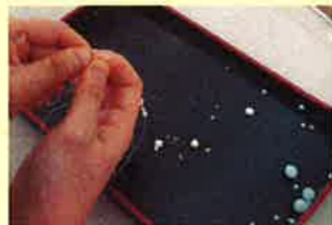
穴に糸を通すのに一苦労