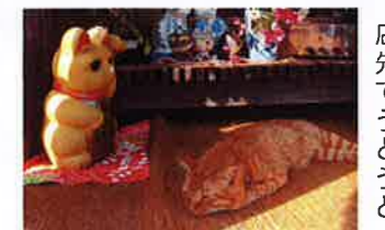
まねき猫うとうと